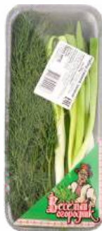
Набор витаминный "Веселый огородник" (лук, укроп), 60 г