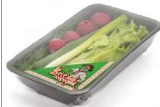
Ассорти Летний микс "Веселый огородник" (салат, редис, укроп, лук), 130 г