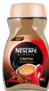
Кофе растворимый "Nescafe" classic crema, 95 г