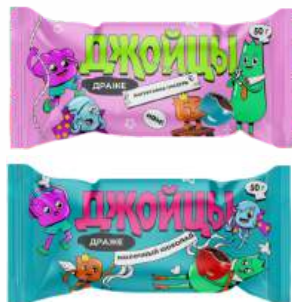
Драже в йогуртовой глазури/ молочный шоколад, 50 г