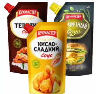
Соус "КУХМАСТЕР" Терияки/Горчичный/Кисло-сладкий, 200 г