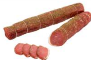
Филей "Дворянский" из свинины мясн. с/в Волковический МК, 1 кг