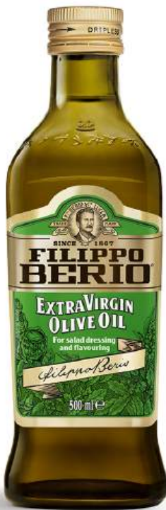
Масло оливковое "Filippo Berio" ExV, 500 мл