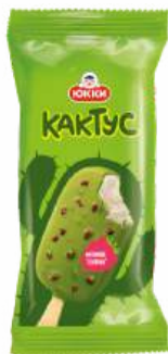
ДЕСЕРТ "ЮККИ" КАКТУС С КУСОЧКАМИ СУШЕНОЙ МАЛИНЫ ЗАМ., 60 Г