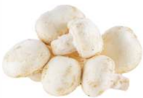
Грибы шампиньоны, 1 кг