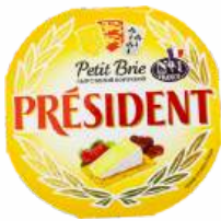
Сыр мягкий "President" Petit Brie с белой плесенью 60%, 125 г