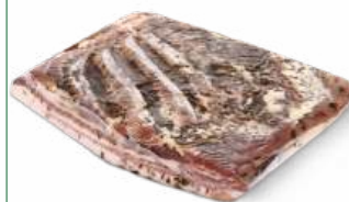
Грудинка по-домашнему "Петруха" охл., 1 кг