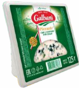
Сыр с голубой плесенью "Galbani" 62%, 125 г