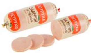
Колбаса "Балерон" Ветчинный в/с охл., 470 г