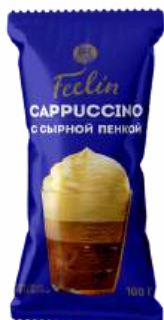
МОРОЖЕНОЕ "FEELIN" ТРЕХСЛОЙНОЕ "КАПУЧИНО С СЫРНОЙ ПЕНКОЙ", 100 Г