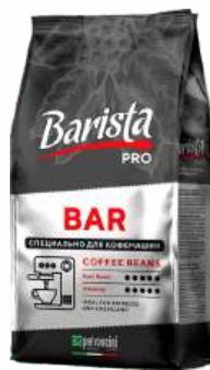
Кофе натур. жарен. в зернах "Barista" Pro Bar, 800 г