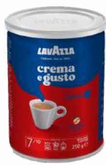
Кофе молотый "Lavazza" Crema e Gusto, 250 г