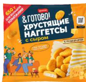
Хрустящие нагетсы с сыром, 650 г