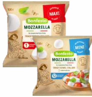
Сыр мягкий "Моцарелла" 45%, 100 г