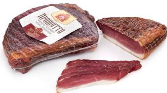
Ветчина "Прощито" с/к из свинины мясн. в/у Гродненский МК, 1 кг