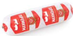
Колбаса вареная "Премимум" в/с Гродненский МК, 1 кг