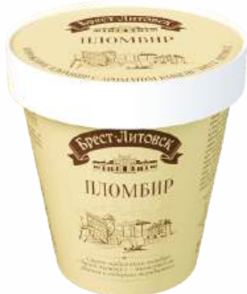
МОРОЖЕНОЕ ПЛОМБИР "БРЕСТ-ЛИТОВСК" С АРОМАТОМ ВАНИЛИ, 220 Г