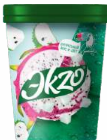
МОРОЖЕНОЕ "ЭКЗО" ДРАГОНФРУТ ГУАНАБАНА, 520 Г