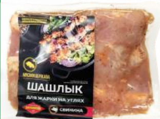
Шашлык для жарки на углях из свинины охл. п/ф Славянский МК, 1 кг

КРОМЕ GREEN: 25, 26, 27, 28, 29, 30, 31, 32, 33, 34 ЦЕН. НА ОБОРОТ