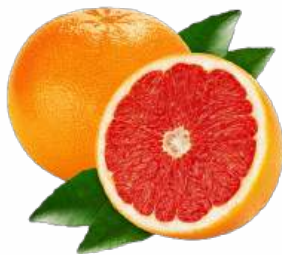
Грейпфрут красный, 1 кг