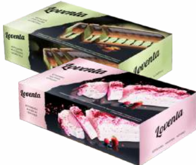
МОРОЖЕНОЕ-ТОРТ ПЛОМБИР "ЛОВЕНТА" ДВУХСЛ. С ПРОТ. МИНД И ФИСТ. СО ВК. МАРЦИПАН/ ЧЕРНИЧНОГО ЧИЗКЕЙКА КУС. МАЛИНЫ, 500 Г