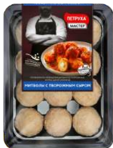
Митболы "Петруха" С творожным сыром, 350 г