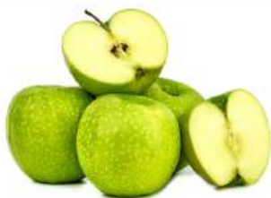
Яблоко Гренни Смит, 1 кг