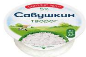
Творог "Савушкин хуторок" 5%, 300 г