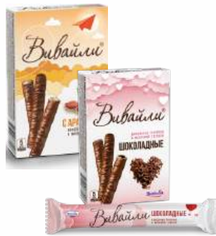
Вафельные трубочки "Витьба" Вивайли с арахисом в молочной глазури/ шоколадные, 95 г