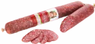
Колбаса оригинальная "Рублевская" с/в мясное в/с Гродненский МК, 1 кг