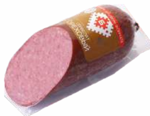
Колбаса "СЕРВЕЛАТ ОРЕХОВЫЙ" в/с в/к салями мясн., 400 г