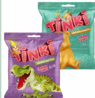
Мармелад "Красный пиццвик" Дынозауры/ Медведзянты, 75 г