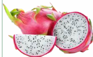
Питахайя, 1 кг