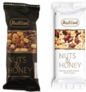
Батончик орехово-медовый "Nats&Honey" в асорт., 45 г