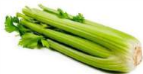
Сельдерей стебель, 1 кг