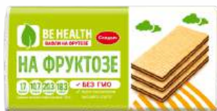
Вафли на фруктозе, 100 г