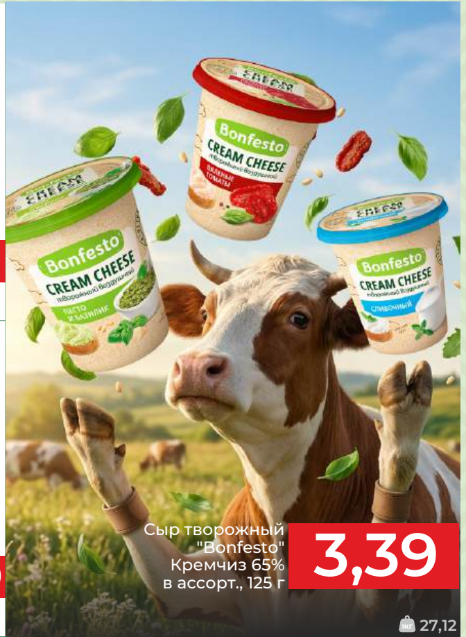
Сыр творожный "Bonfesto" Кремчиз 65% в ассорт., 125 г