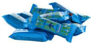
Конфеты "Спартак" Аэрофлотские глазуров., 1 кг