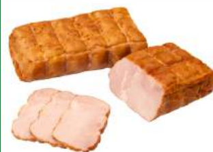
Рулет "Панский гранд" из свинины мясной к/в Волковический МК, 1 кг