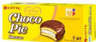
Мучное конд. изделие "Chocorie" Lotte Банан, 168 г