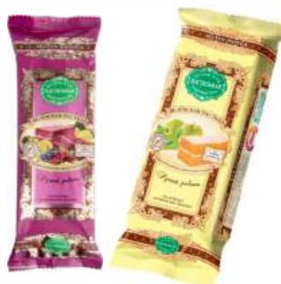
Пастила "Беловская" без сахара в асорт., 50 г