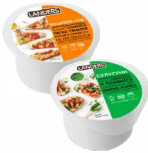
Сыр "Моцарелла Голд"/"Сулугуни" 40%, 200 г