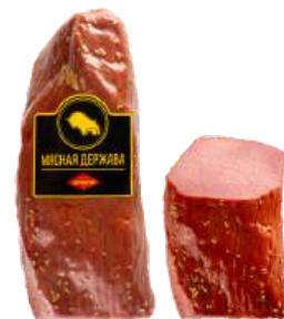
Говядина "Святочная" мясн. к/в в/у, 1 кг