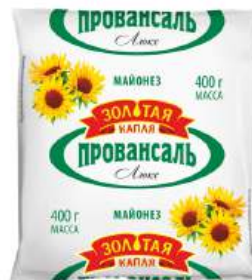
Майонез "Золотая Капля" Провансаль Люкс 67%, 400 г