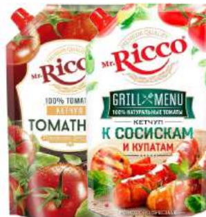
Кетчуп "Mr. Ricco" Томатный/Menu К сосискам и купатам, 300 г