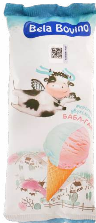
МОРОЖЕНОЕ "BELA BOVINO" ПЛОМБИР БАБЛ-ГАМ 15%, 80 Г