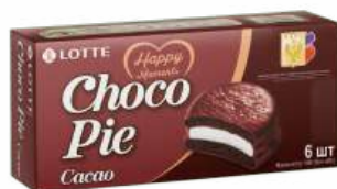
Мучное кондитерское изделие в глазури "CHOCORIE" CACAO Lotte, 168 г