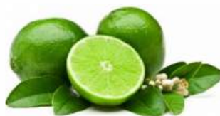
Лайм, 1 кг