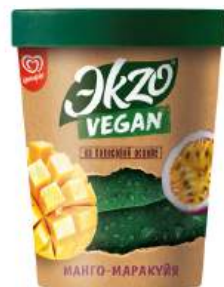
ДЕСЕРТ "ЭКЗО ВЕГАН" МАНГО-МАРАКУЙЯ ПИНТА ЗАМ., 270 Г