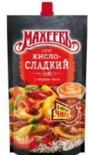
Соус деликатесный "Махеев" Кисло-сладкий, 230 г