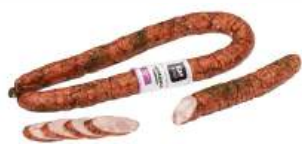
Колбаса «Домашка свиная» в/с п/к мясная Волковический МК, 1 кг