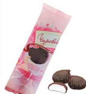
Зефир "Чаровой" Ванильный в шоколаде, 95 г