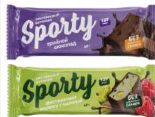
Батончик протеиновый глазированный "SPORTY" в асорт., 40 г