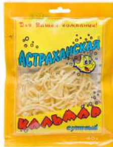
Кальмар стружка тихоокеанский "Астраханкина" суш-вял., 40 г