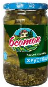
Корнишоны хрустящие "Босток", 350 мл