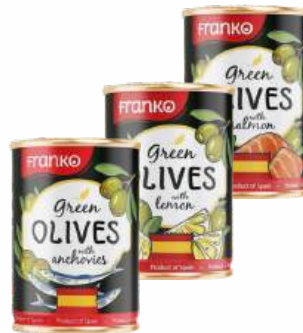
Оливки "Franko" зеленые фаршированные в ассорт., 280 г