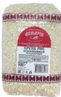
Крупа рис "Мелькруп" круглозерный, 800 г