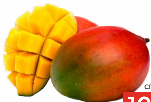
МАНГО СПЕЛОЕ, 1 КГ