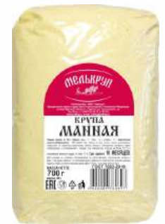
Крупа манная "Мелькруп", 700 г