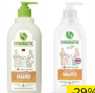
Средство биоразлагаемое для мытья рук и тела "Synergetic" Фрукт микс/Миндальное молочко, 500 мл

ТОЛЬКО GREEN: 1-9, 11-17, 25, 34, 34 (СМ. НА ОБОРОТЕ)