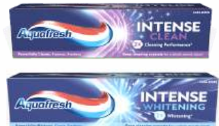
Зубная паста "Aquafresh" Intense Clean/Whitening, 75 мл