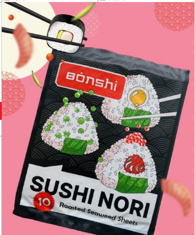
Водоросли морские "Bonshi" ламинария японская для суши суш. прессов. жарен., 28 г (10 листов)