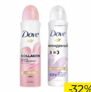
Антиперспирант "DOVE" pro-collagen/Невидимый, 150 мл

ТОЛЬКО GREEN: 1-9, 11-17, 19, 20 (СМ. НА ОБОРОТЕ)