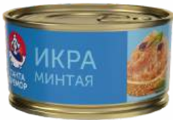
Икра минтая деликат "Санта Бремор" Люкс, 130 г