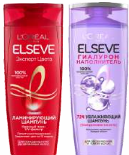
Шампунь "ELSEVE" Эксперт цвета/Увлажняющий Гиалурон, 400 мл