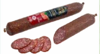
Колбаса "Раубицкая премиум" в/с/к салями Борисовский МК, 1 кг