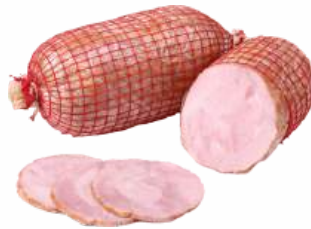
Буженина "Домашняя" из свинины мясн. к/в Брестский МК, 1 кг