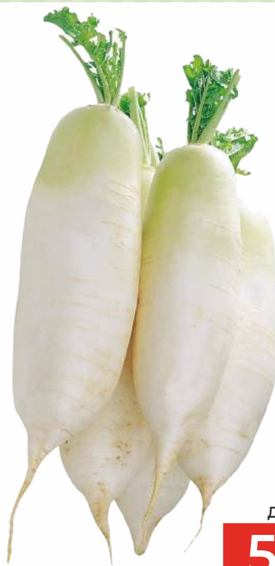
РЕДИС ДАЙКОН, 1 КГ