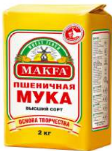
Мука пшеничная "Макфа" в/с, 2 кг