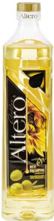
Масло подсолнечно- оливковое "Altero" рафин., 810 мл