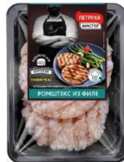
Ромштекс из филе п/ф рубл. из мяса цыплят-бройлеров охл., 250 г