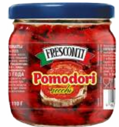
Томаты вяленые в масле "Fresconti", 200 г