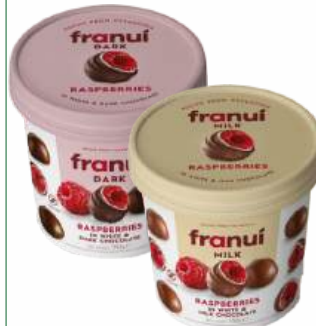
Ягоды малины замороженные "Ffranui" в белом и молочном шоколаде/темном шоколаде, 150 г