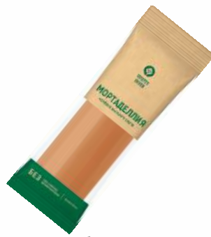
Колбаса "Мортаделлия" в/с вар. из мяса птицы, 420 г