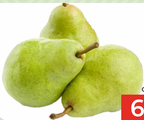
ГРУША ОКСАНА, 1 КГ