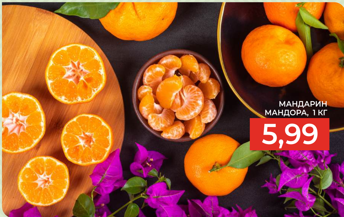
МАНДАРИН МАНДОРА, 1 КГ