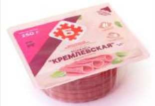
Колбаса "Кремлевская" в/с в/к салями мясн. Брестский МК, 250 г