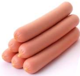
Сосиски "Вкусные с молоком" в/с вар. мясн. Брестский МК, 1 кг