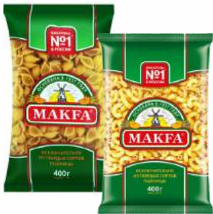
Макаронные изделия "Макфа" Ракушки/Рожки гладкие в/с, 400 г