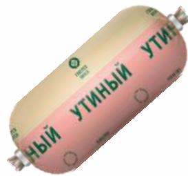
Утиный паштет охл. оболочка, 180 г