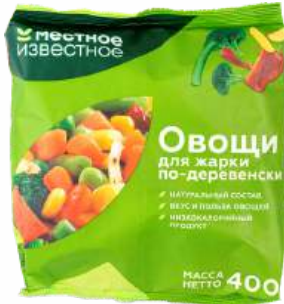
Овощная смесь "Местное Известное" Овощи по-деревенски быструмам., 400 г