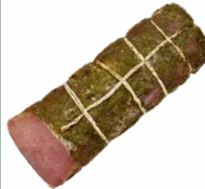
Полендвица "Вясковая" с/в охл., 1 кг