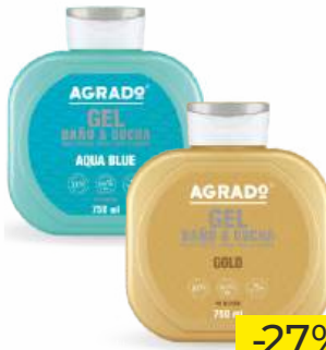
Гель для ванны и душа "AGRADO" Aqua Blue/Gold, 750 мл