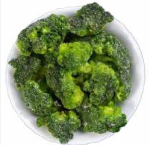
Капуста брокколи с/м вес., 1 кг