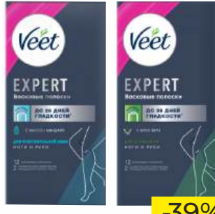
Восковые полоски "Expert Veet" для сухой/чувствительной кожи, 12 шт