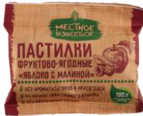
Пастилки фруктово-ягодные "Местное Известное" Яблоко с малиной, 70 г