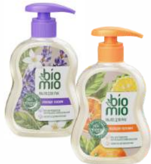
Мыло жидкое "BioMio" Апельсин и Бергамот/Лаванда, 300 мл