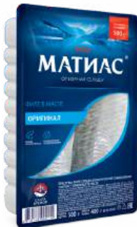
Сельдь филе оригинальное "МАТИАС", 500 г