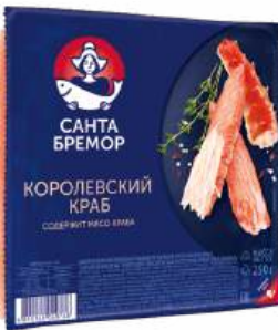
Палочки крабовые "Санта Бремор" Королевский краб охл., 250 г