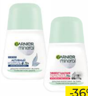
Дезодорант-антиперспирант "GARNIER" Активный контроль/Эффект магия, 50 мл