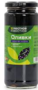
Оливки черные без косточки "Местное Известное", 340 г