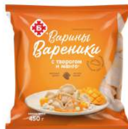
Вареники "Варины Вареники" с творогом и манго зам., 450 г

КРОМЕ GREEN: 25,26,28,29 (СМ. НА ОБОРОТЕ)