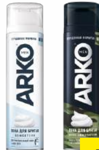
Пена для бритья "Arko" Men в ассорт., 200 мл