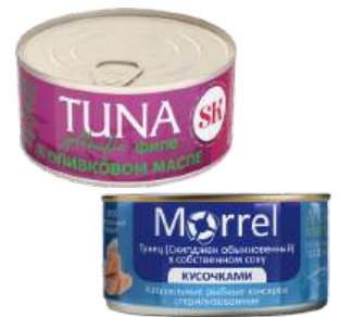
Туец кусочками "Morrel"/филе "Yellowfin", 185/140 г