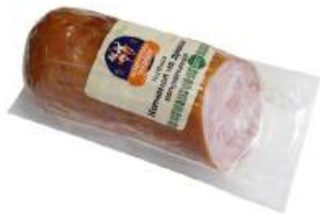
Колбаса п/к "Копченая на дровах" в/у, 420 г