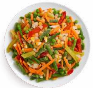
Смесь овощная "Мексиканская" зам. вес., 1 кг