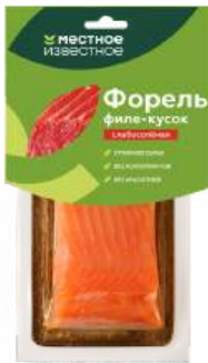
Форель филе-кусочки "Местное Известное" с/с с/к, 150 г