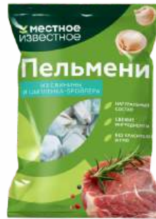
Пельмени из свинины и цыпленка-бройлера "Местное Известное" замороженные, 400 г