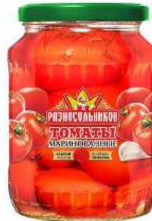
Томаты маринованные "Разносольников", 680 г

КРОМЕ GREEN: 9.25.26.28.32-34 (см. на обороте)