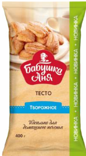
Тесто творожное "Бабушка Аня" п/ф зам., 400 г