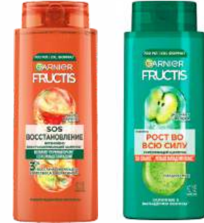
Шампунь для волос "Fructis" SOS-восстановление/Пост во всю силу, 700 мл