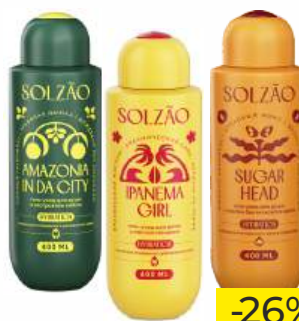
Гель-уход для душа "Solzao" Amazonia In Da City/Ipanema Girl/Sugar Head, 400 мл