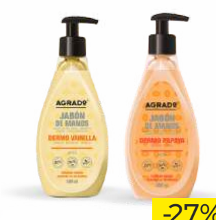
Мыло для рук жидкое "AGRADO" Ваниль/Папайя, 500 мл