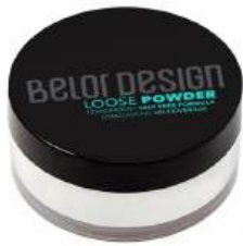
Пудра рассыпчатая для лица "BELOR DESIGN" 11

КРОМЕ GREEN: 4,9, 13, 16, 17, 25, 27-29, 33, 34 (СМ. НА ОБОРОТЕ)