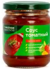
Соус томатный "Местное Известное" Наполетана стерилиз., 260 г