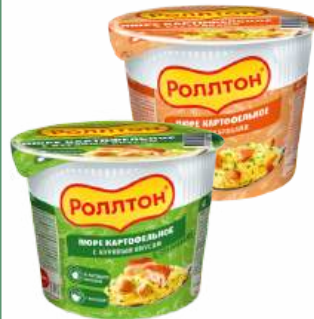
Пюре картофельное "Роллтон" с куриным вкусом/с сухариками, 40 г