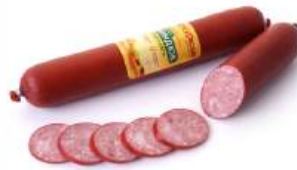
Колбаса "Киндюк" в/к салями мясное в/с, 1 кг