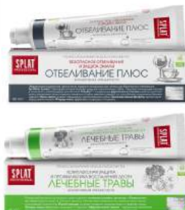
Зубная паста "Splat" Professional Отбеливание плюс/Лечебные травы, 40 мл