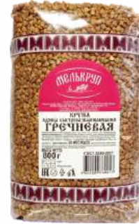
Крупа гречневая ядрица "Мелькруп" быстрозарваривающаяся, 800 г