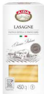
Макаронные изделия "AIDA" Lasagne из твердых сортов пшеницы, 450 г