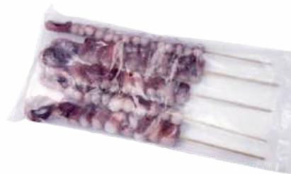
КАЛЬМАР ШУПАЛЬЦА ОЧИЩЕННЫЕ КУСОЧКИ НА ШПАЖКЕ ЗАМ., 500 Г