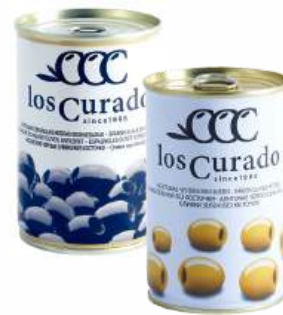
Оливки черные/зеленые "Los Curado" б/к, 300 г