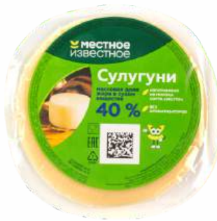
СЫР "МЕСТНОЕ ИЗВЕСТНОЕ" СУЛУГУНИ 40%, 1 КГ