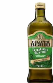
Масло оливковое "Filippo Berio" ExV, 750 мл