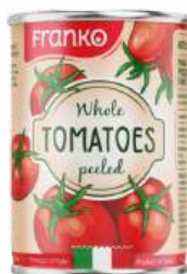
Томаты "Franko" консервированные очищенные целые в собственном соку ж/б, 400 г