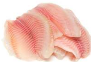
Филе тилапии с/м, 1 кг