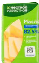
Масло сливочное "Местное Известное" 82,5%, 180 г