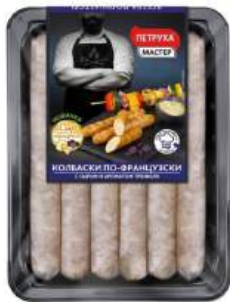
КОЛБАСКИ "ПО-ФРАНЦУЗСКИ" С СЫРОМ И АРОМАТОМ ТРЮФЕЛЯ ОХЛ., 600 Г