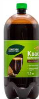
Квас белорусский "Местное Известное" Оригинальный, 1,5 л