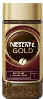
Кофе растворимый сублим. "Nescafe" Gold с добавлением молот. кофе, 95 г