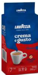
Кофе молотый "Lavazza" Crema e Gusto в/у, 250 г