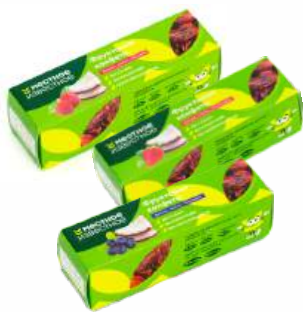
Снек фруктовый финик-кокос- клубника/малина/ черника "Местное Известное", 38 г