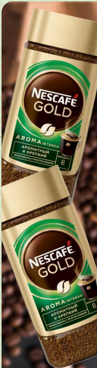
Кофе растворимый сублим. "Nescafe" Gold Aroma Intenso с добавл. молот. кофе, 85 г