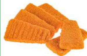
Лососевые порции из фарша рыбного "VICI" ОРИГИНАЛЬНЫЕ в панировке обжар. зам. п/ф, 1 кг