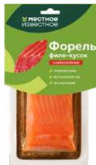
Форель филе-кусоч "Местное Известное" с/к с/с, 300 г