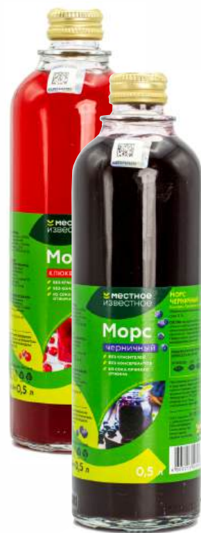
Морс клюквенный/ черничный "Местное Известное", 500 мл