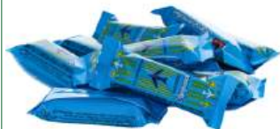
Конфеты "Спартак" Аэрофлотские глазированные, 1 кг