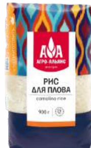
Рис для плова "Агро-Альянс" Экстра-2, 900 г