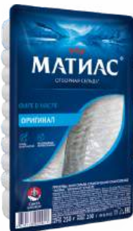
Сельдь филе оригинал "МАТИАС", 250 г