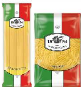
Макаронные изделия "Pasta napoletana" Спагетти/Перья, 400 г