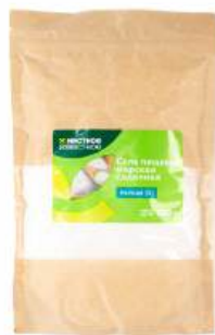
Соль морская пищевая мелкая "Местное Известное", 600 г