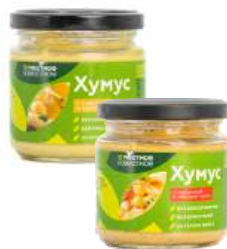
Хумус из нута с "Местное Известное" Паприка и перец чили/Куркума и карри, 180 г