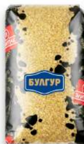
Булгур крупа пшеничная "ЭлитПак", 400 г