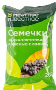
Семечки подсолнечника "Местное Известное" жареные с солью, 200 г