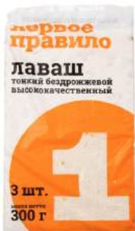
ЛАВАШ ТОНКИЙ БЕЗДРОЖЖЕВОЙ "ПЕРВОЕ ПРАВИЛО", 3 ШТ (300 Г)