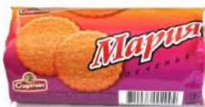
Печенье "Спартак" Мария, 140 г