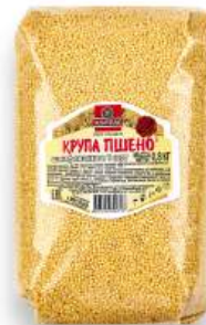
Крупа пшено шлифованное "ЭлитПак" 1 сорт, 800 г