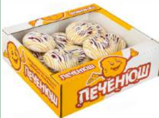
Пирожные бисквитные "ПЕЧЕНЮШ" вишневый с белой глазурью, 400 г