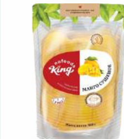
Манго сушеное "King Nafoods", 500 г