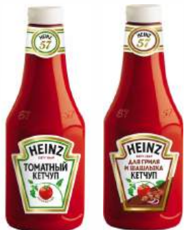
Кетчуп "Heinz" в ассорт., 800 г