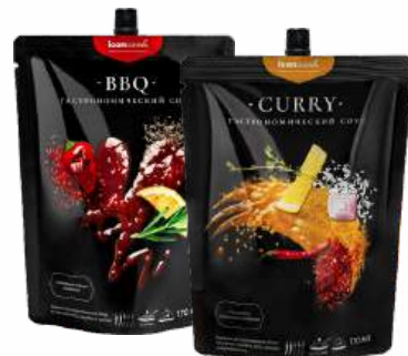
СОУС "ICANCOOK" БАРБЕКЮ/КАРРИ, 180 Г