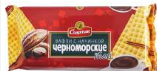
Вафли "Спартак" Черноморские, 87 г