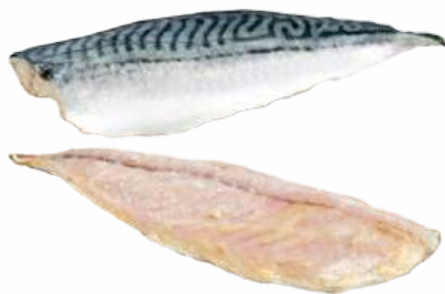
ФИЛЕ СКУМБРИИ В МАРИНАДЕ ЗАМ. ФАС., 1 КГ