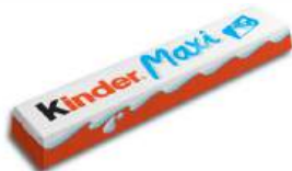
Шоколад "Kinder" Макси, 21 г