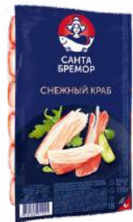
Крабовые палочки "Снежный краб" охл. в/у, 150 г