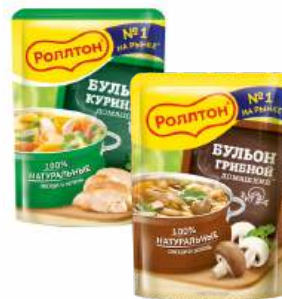
Бульон "Роллтон" куриный/грибной домашний, 90 г