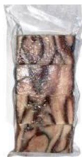
Филе сельди н/к с/м, 400 г