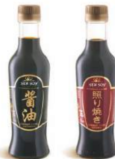
Соус соевый "Сэн Сои" премиум/премиум терияки, 220 мл