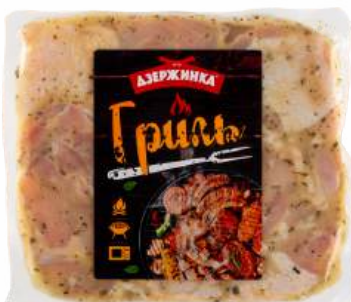
ШАШЛИК "ПРЯНЫЙ ДЛЯ ПИКНИКА" ИЗ МЯСА ЦЫПЛЯТ- БРОЙЛЕРОВ ОХЛ. В/У П/Ф БЕСКОСТН., 1 КГ