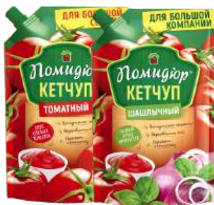
Кетчуп "Помидор" томатный/шашлычный, 420 г