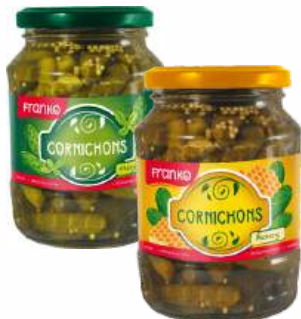
Корнишоны "Franko" маринованные в ассорт., 340 г