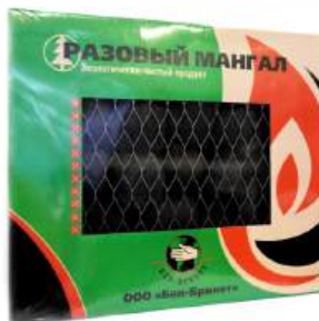
МАНГАЛ ОДНОРАЗОВЫЙ 5,5 CM X 31,5 CM X 26,5 CM