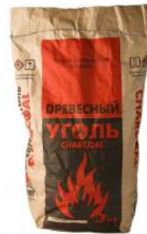
УГОЛЬ ДРЕВЕСНЫЙ СМЕШАННЫХ ПОРОД, 3 КГ