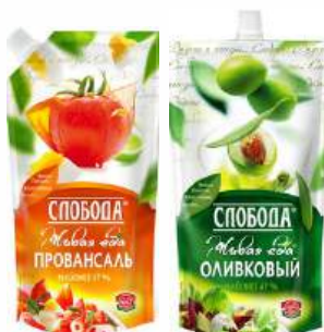
Майонез "Слобода" Провансаль классический/оливковый 67%, 200 мл