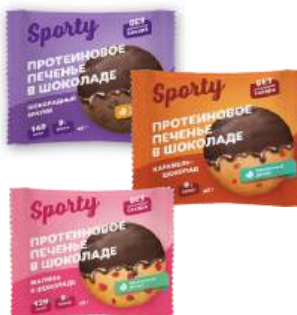
Печенье глазированное "SPORTY" обогащенное белком в ассортименте, 40 г