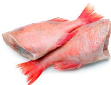
ОКУНЬ МОРСКОЙ Б/Г 150-300 Г МОРОЖ., 1 КГ