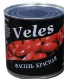
Фасоль красная "Veles" натуральная, 400 г