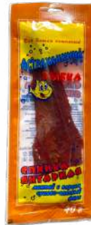
Минтай/Желтый полосатик желтополосый "Астраханка" с/в, 40 г