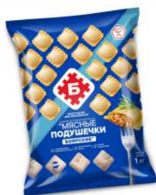
Мясные подушечки "БОЯРСКИЕ" п/ф зам. фас., 1 кг