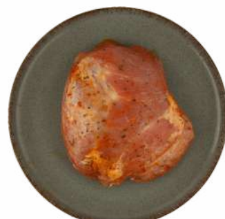
БУЖЕНИНА ДЛЯ ЗАПЕКАНИЯ П/Ф ОХЛ., 1 КГ