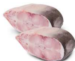
Стейк пангасиуса н/к с/м фас., 1 кг