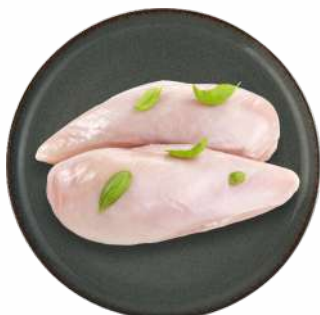
ФИЛЕ ЦЫПЛЕНКА-БРОЙЛЕРА ОХЛ., 1 КГ