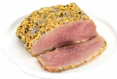
ОКОРОК "МЕСТНОЕ ИЗВЕСТНОЕ" АППЕТИТНЫЙ С ОВОЩАМИ И ПРЯНОСТЯМИ С/В, 1 КГ