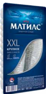
Сельдь филе отборное "Матилас", 300 г