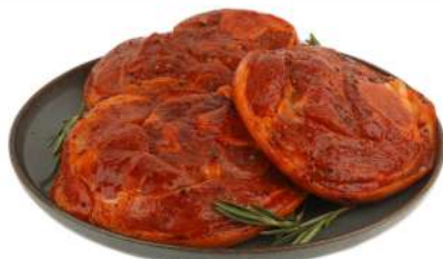
СТЕЙК ИЗ РУЛКИ В МАРИНАДЕ П/Ф ОХЛ., 1 КГ