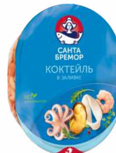
Коктейль из морепрод. в заливке "Санта Бремор" Классик, 180 г