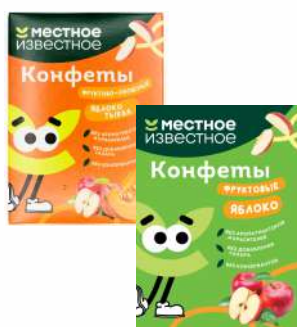
Конфеты фруктово- ягодные "Местное известное" Хоба яблоко-тыква/яблоко, 60 г