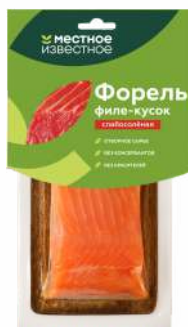
Форель филе-кусочек "Местное Известное" с/к с/с, 300 г