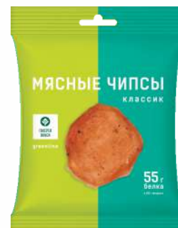
Колбаса "Салами чипс классик" экстра с/в из мяса цыплекна-бройлера охл., 30 г