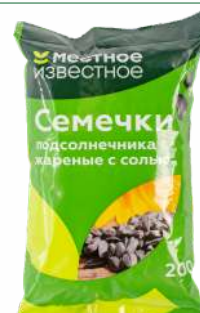
Семечки подсолнечника "Местное Известное" жареные с солью, 200 г