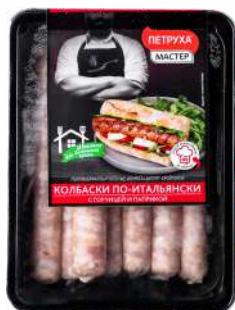
Колбаски "По- Итальянски" п/ф лоток охл., 600 г