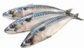
Скумбрия атлантическая 400-600 морож., 1 кг