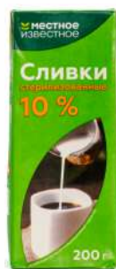
Сливки стерилизованные "Местное Известное" 10%, 200 мл