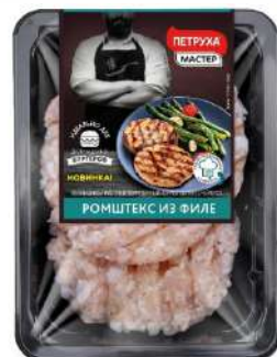
РОМШТЕКС ИЗ ФИЛЕ (ЛОТОК) ОХЛ., 250 Г