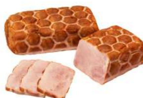
Рулет "Замковый гранд" из свинины мясной целной кусовой мякотной к/в, 1 кг