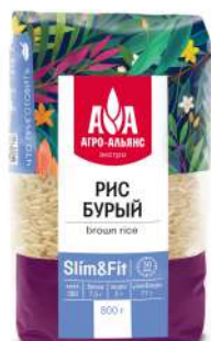
Рис Бурый "Агро-Альянс" Экстра, 800 г