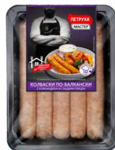
КОЛБАСКИ "ПО-БАЛКАНСКИЙ" ОХЛ. ФАС., 600 Г