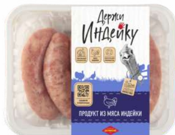
КУПАТЫ "СЕЛЬСКИЕ" ОХЛ. ФАС., 500 Г