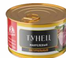
Тунец макрелевый "За родину" куски натур., 230 г