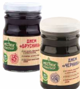
Джем без сахара "Местное Известное" брусника/черника , 220 г