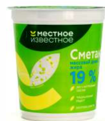
Сметана "Местное Известное" 19%, 380 г