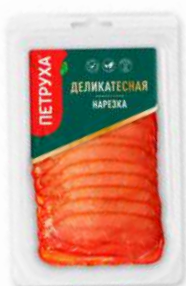
Ковалочек "Мясоградский" с/к серв/н охл., 150 г