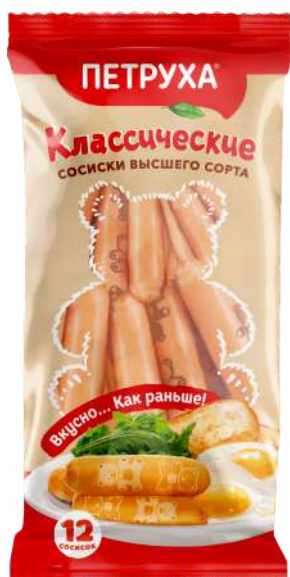
Сосиски "Классические" вар. в/с охл., 480 г