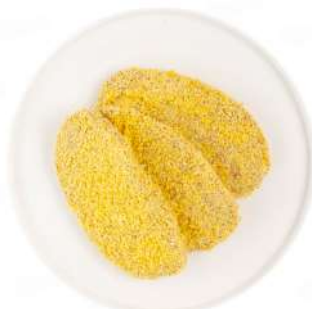
ШНИЦЕЛЬ ИЗ МЯСА ЦЫПЛЕНКА-БРОЙЛЕРА С СЫРОМ П/Ф ОХЛ., 1 КГ