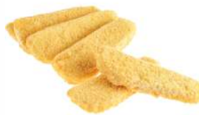
Порции из фарша минтая в панировке обжаренные замороженные "Vici" п/ф, 1 кг