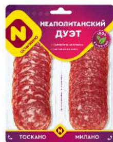
Готовый продукт из мяса "Неаполитанский дуэт" с/к с/н, 90 г