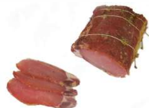
Продукт из свинины с/в "Филей Королевский престиж", 1 кг