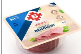
Колбаса "Сервелат венский" в/с колб. изд. в/к салями мясн., 250 г