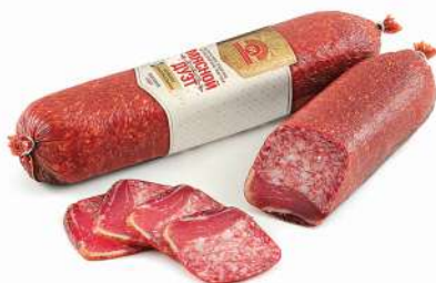
КОЛБАСА ОРИГИНАЛЬНАЯ "МЯСНОЙ ДУЭТ"/"МЯСНОЙ КАПРИЗ" С/К МЯС. ГРОДНЕНСКИЙ МК, 1 КГ