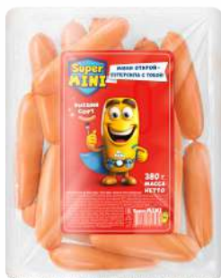
Сосиски "Супер Мини" в/с охл., 380 г