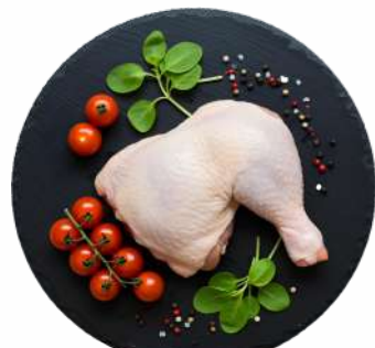
ОКОРОЧОК ЦЫПЛЕНКА-БРОЙЛЕРА ОХЛ., 1 КГ