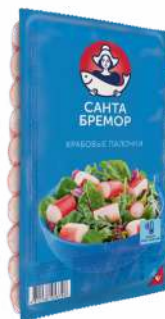
Палочки крабовые "Санта Бремор" имитация паст охл., 200 г