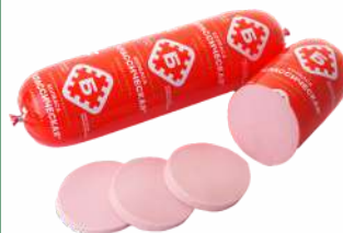
Колбаса "Классическая" в/с вар., 1 кг