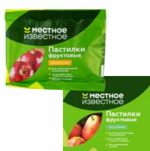
Пастилки фруктовые "Местное Известное" Яблочные, грушевые 70 г