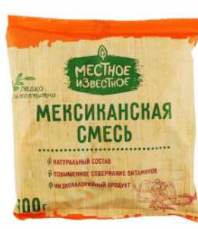
Смесь овощей "Местное Известное" Мексиканская быстрозамор., 400 г