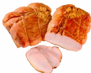
Буженина "Могилевская новая" из свинины к/в порц. нар., 1 кг